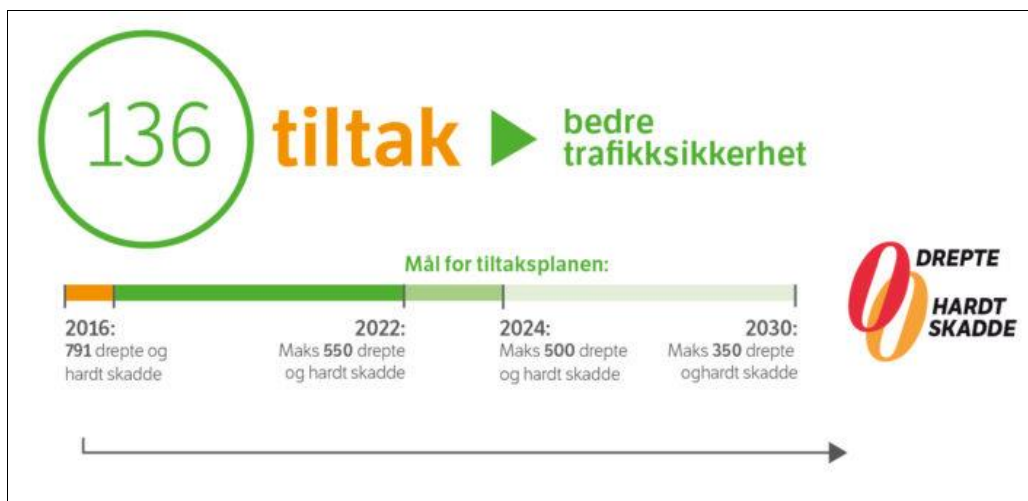
Figur 1: 0-visjon (Nasjonal tiltaksplan for trafiksikkerhet på veg 2018-2021, s.12)