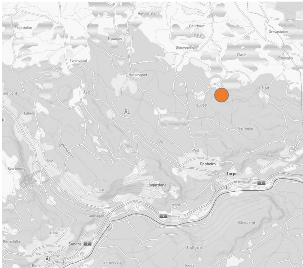
Figur 1 Oversiktskart. Leikvollstølen ligger på Torpoåsen i Ål kommune, se rød ring i kartet.